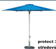
protect 300M středový tyč