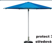
protect 340M středová tyč