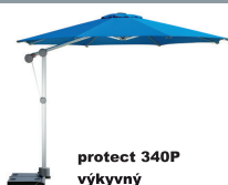
protect 340P výkyvný