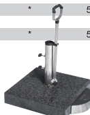
Žulový sokl Follow me hmotnost : 60 kg Art.č. 85897FM