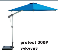
protect 300P výkyvný